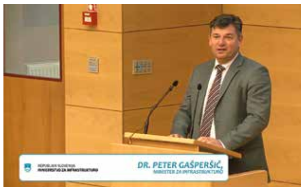
Minister za infrastrukturo dr. Peter Gašperšič je podprl javno predstavitev rezultatov analize komentarjev in pripomb na »Predlog usmeritev za pripravo EKS« z uvodnimi besedami